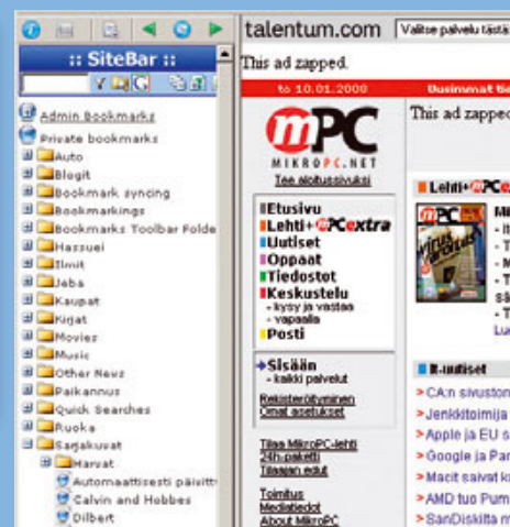
◀ SiteBar sulautuu selainnäkömään omalla tavallaan. Monipuolisen palvelun ehkä suurin etu on mahdollisuus oman synkronointipalvelimen käyttöön.

Avainsanoitukselle ja kaikkialta saavutettavalle palvelulle on helppo keksiä perinteistä merkausta laajempaakin käyttöä. Sopivia sanoja hakulaatikkoon naputtelemalla voi metastää itseä kiinnostavia linkkivinkkejä myös muiden käyttäjien merkinnöistä.