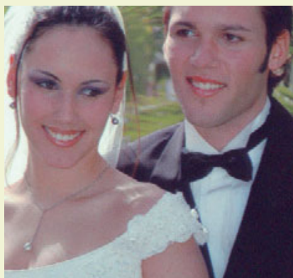
Canon Selphy CP730