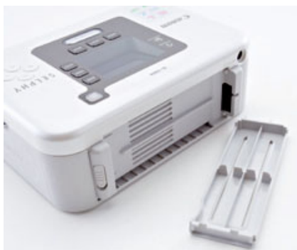
▲ Canonin Selphy-tulostimessa on akkupaikka laitteen takana luukun alla. Itse akku on kuitenkin valinnainen lisävaruste.