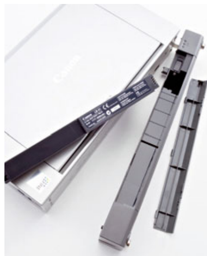
► Canonin Pixmassa (kuvassa) akkukäyttö vaatii askartelua monimutkaisen, ruuvailtavan kotelo/sovitinvirityksen kanssa. HP:ssä akku napsautetaan suoraan tulostimen takaseinään.