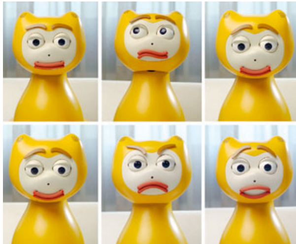
Ulkonäöstä päätellen iCat-kissa on Simpsonien sukua.

Kissanomistajat tietävät, että ymmärretyllään puheella ei aina ole toivottua vaikutusta. ■