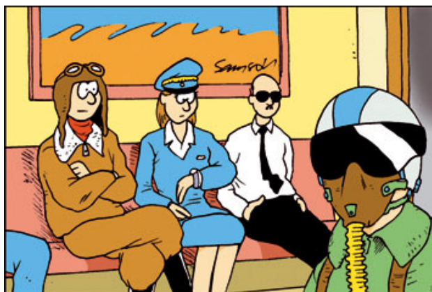
Projektiryhmä kantoi huolta pilottiprojektin pysymisestä aikataulussa.